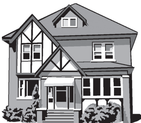
Byahus med IT-café, kiosk, företagare-hotell, sporthall, badhus - vem vet vad det kan bli?