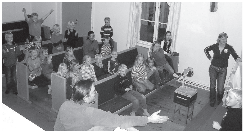
Tävling mellan Miniscouter och Himlakul